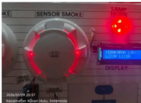
Gambar 3. Sensor Smoke Kondisi Bekerja

Sensor tidak mendeteksi partikel asap dan keluaran relay berada dalam kondisi default, menandakan sistem aman. Kondisi kedua sensor dipaparkan asap dari sumber buatan (misal: pembakaran kayu kertas), dan keluaran relay berubah untuk mengaktifkan jalur sinyal alarm.