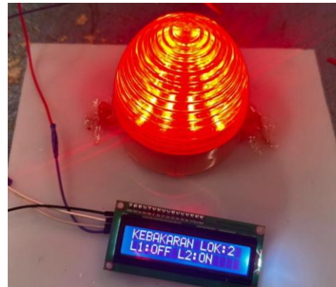
Gambar 4. Display ON

Pengujian blok proses dilakukan untuk memverifikasi kemampuan mikrokontroler dalam membaca sinyal input serta mengirim sinyal output sesuai logika sistem.