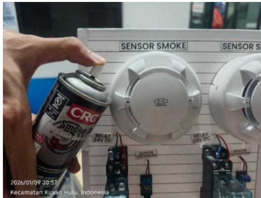
Gambar 2. Sensor Smoke Kondisi Normal

Sensor tidak mendeteksi partikel asap dan keluaran relay berada dalam kondisi default, menandakan sistem aman. Kondisi kedua sensor dipaparkan asap dari sumber buatan (misal: pembakaran kayu kertas), dan keluaran relay berubah untuk mengaktifkan jalur sinyal alarm.