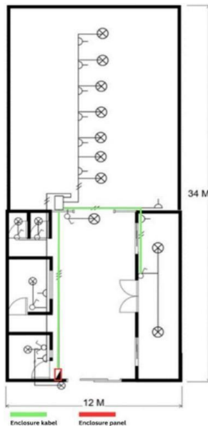
Gambar 1. Layout Instalasi Wiring Lama